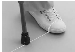
足元を照らす レーザー光